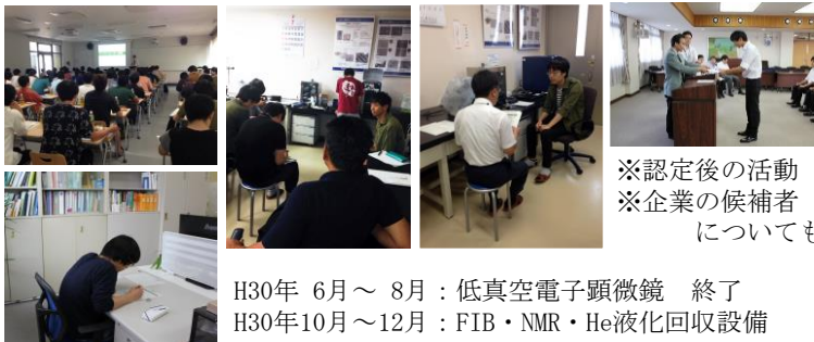
H30年 6月～8月：低真空電子顕微鏡 終了 H30年10月～12月：FIB・NMR・He液化回収設備